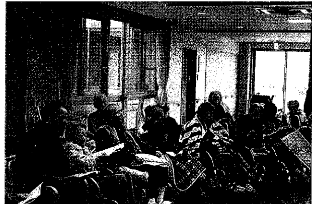
箏とギターのコンサート